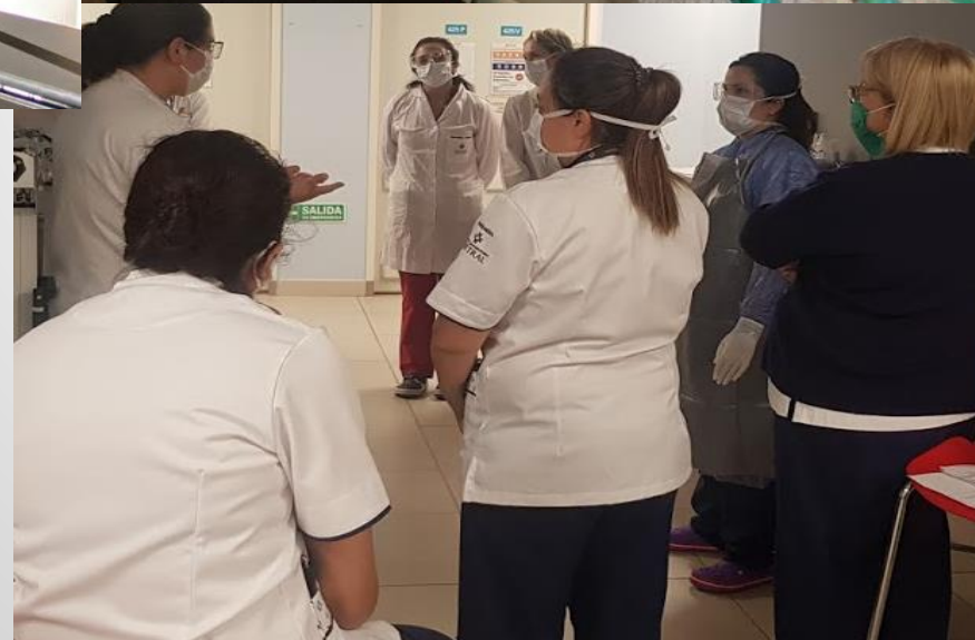
Reunión de equipos y mandos medios